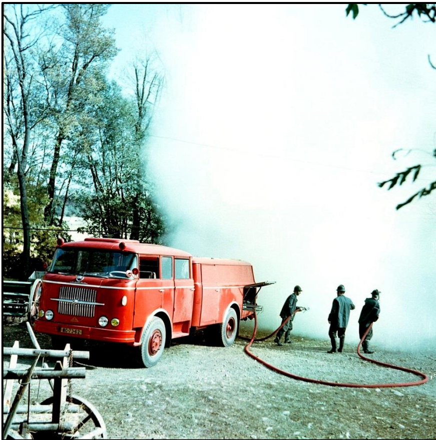
Automobilová stříkačka cisternová ASC – 16 na podvozku Škoda 706 RTHP