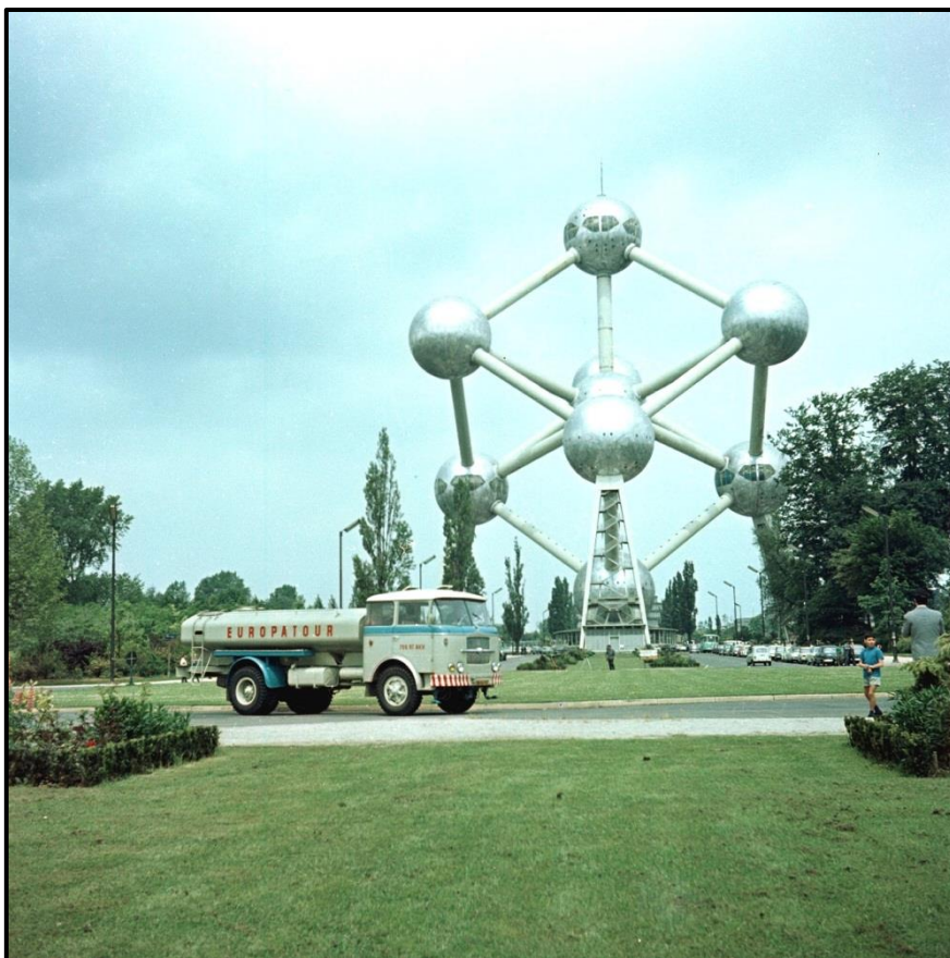
Automobilový kropicí vůz AKV na podvozku Škoda 706 RTH v Bruselu