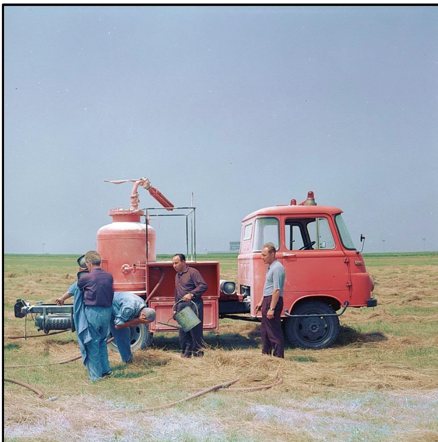
Práškový hasicí automobil PR – 800 na podvozku Robur