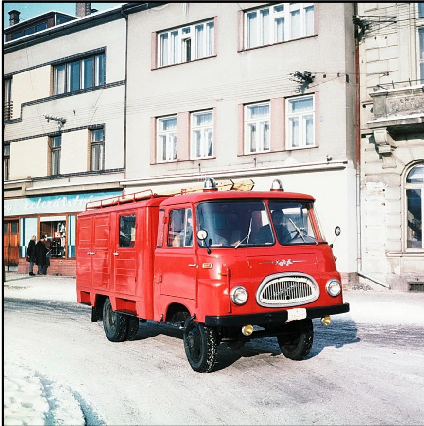
Dopravní vůz DV – 8 na podvozku Robur