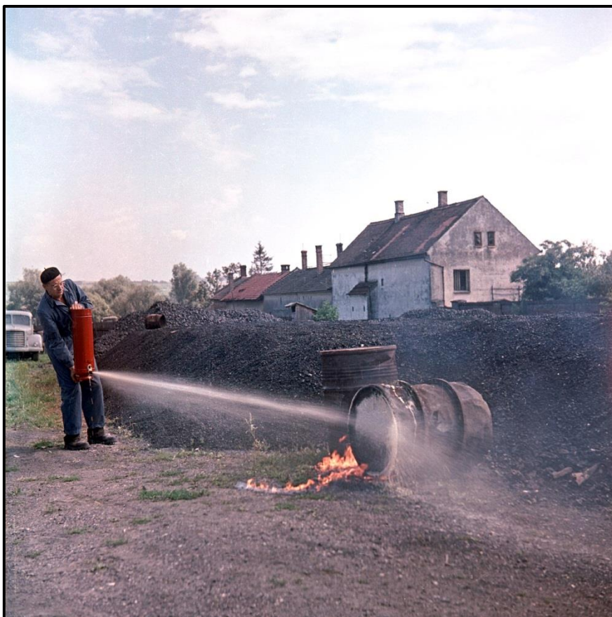
Použití pěnového hasicího přístroje