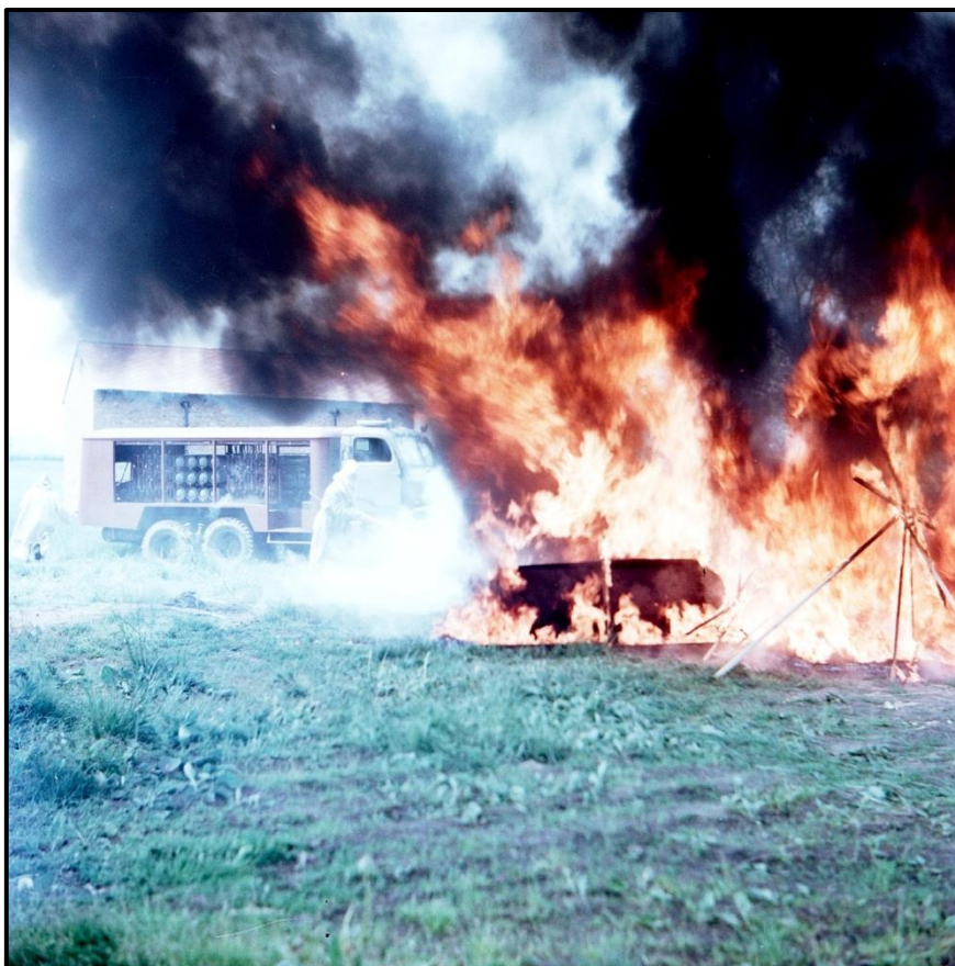
... a praktické použití na zkušebně požárně technických prostředků