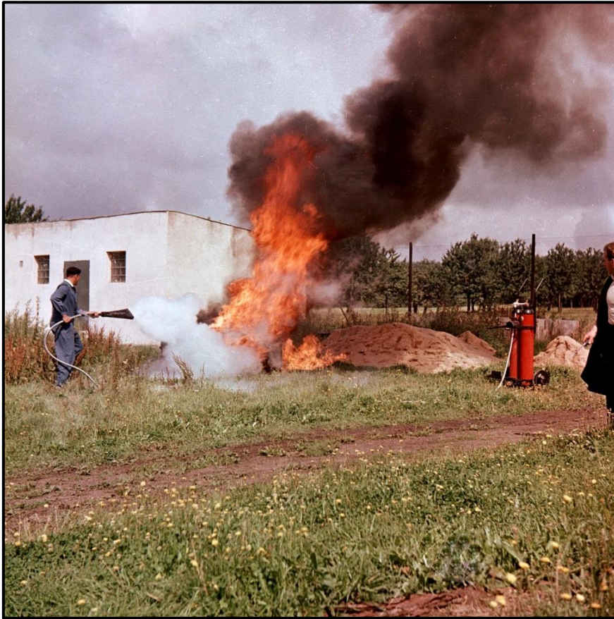
Použití pojízdného sněhového hasicího přístroje S 2x30