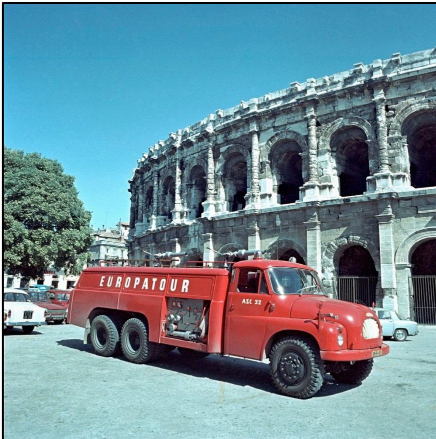
Automobilová stříkačka cisternová ASC – 32 na podvozku Tatra T – 138 v Nîmes