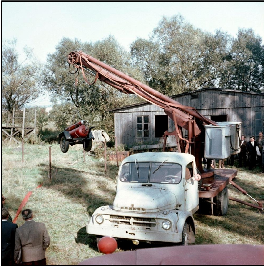
Vysokozdvížná plošina Praga S5T a pojízdný pěnový hasicí přístroj VP – 200