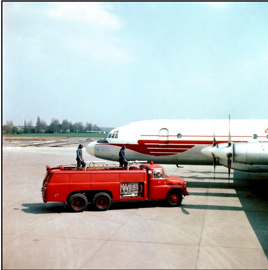
Prototyp pěnového letištního speciálu PL – 1 na podvozku Tatra T – 138