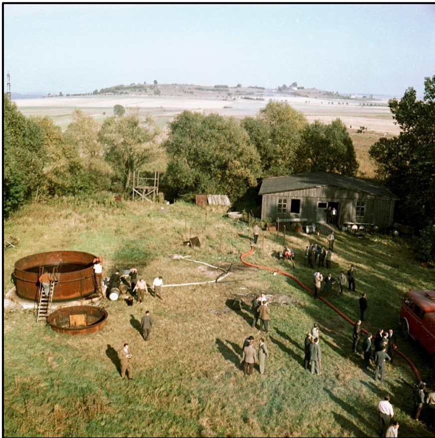
Zkušebna požárně technických prostředků a hasicích látek