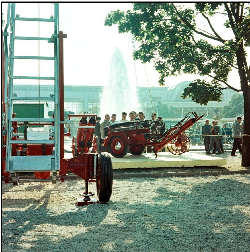
Pavilon THZ n.p. na různých výstavách a veletrzích – 50. léta 20. století