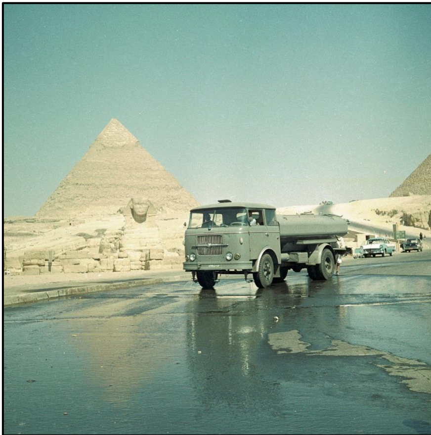
Automobilový kropicí vůz AKV na podvozku Škoda 706 RTH v Egyptě