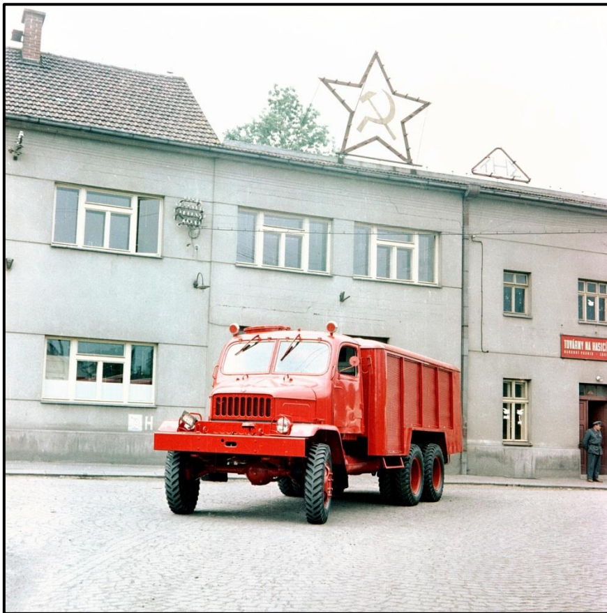
Hasičský vůz sněhový – S 1000 / V3S ...