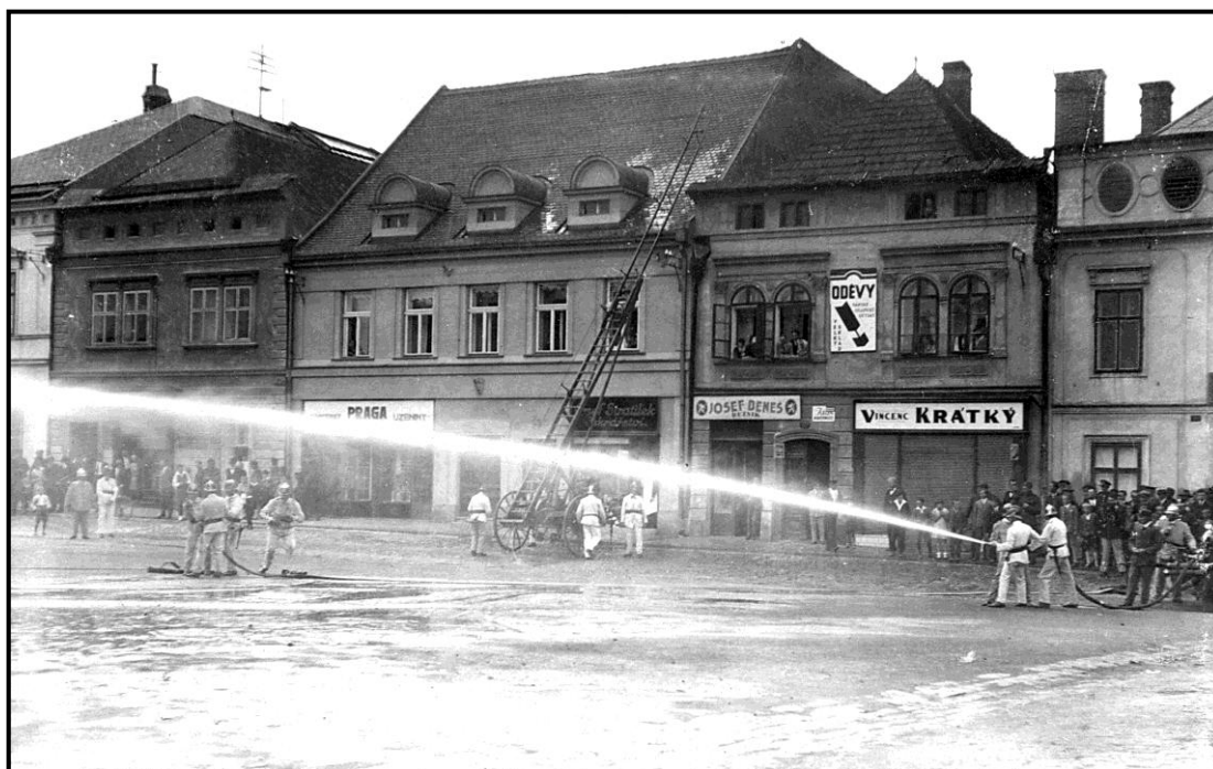
4. srpna 1929 - ukázka při slavnostním předání motorové stříkačky vysokomýtským hasičům

Poválečné roky se ve firmě nesly ve znamení nadšení a dalších plánů rozvoje továrny. V roce 1946 se rýsovaly znovu možnosti exportu do zahraničí a mimo jiné i spolupráce s Velkou Británií. Potvrzením mimořádného postavení Stratílkovy továrny byl i úspěch na mezinárodním vzorkovém veletrhu v Praze v r. 1947. Zdálo se, že pro blížící se 50. výročí založení firmy v roce 1949 nestojí nic v cestě, aby se mohla prezentovat a rozvíjet dál a svými výrobky obstát ve světové konkurenci. Přišel však únor 1948. Václav a Vlastimil museli odejít z podniku, který léta společně budovali. Václav byl vzápětí Státní bezpečností obviněn z napomáhání přípravě opuštění republiky a za velezradu. Odsouzen byl na 15 let do vězení. Vlastimil nemohl najít zaměstnání, až po čase se mu podařilo sehnat místo skladníka v nově budovaném státním podniku Mototechna, ale i to jen dočasně. Jméno firmy Václav Ignác Stratílek zaniklo. Začaly se psát jiné dějiny.